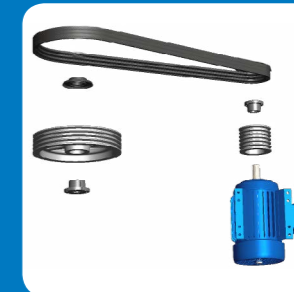
Motore maggiorato & Sistema di trasmissione