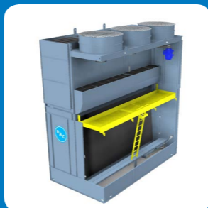
Piattaforma interna con scala