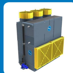
Attenuatore aspirazione + scarico