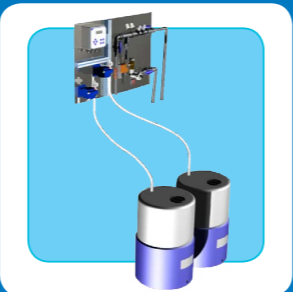
Controllo di spurgo automatico BCP