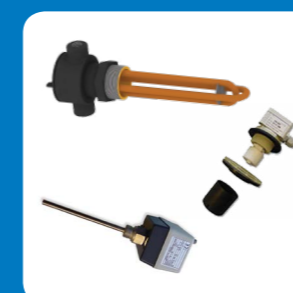
Kit riscaldatori bassa temperatura