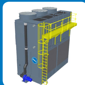
Piattaforma esterna di manutenzione, scaletta & ringhiera perimetrale