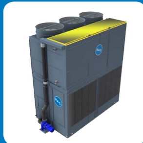
Scudi ingresso aria superiore