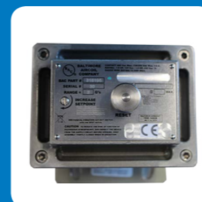
Interruttore di vibrazioni