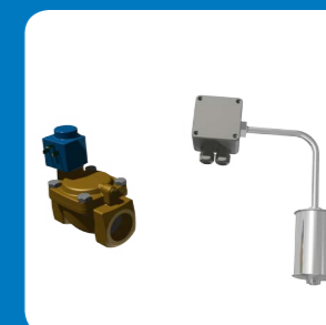
Kit controllo elettrico del livello acqua