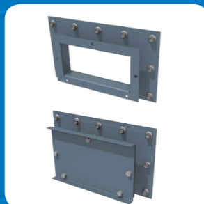
Portello di lavaggio