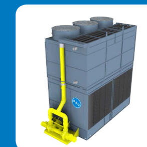
Pompa di riserva