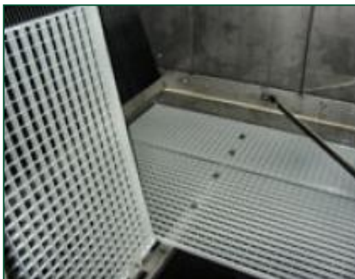
Plate-forme de maintenance interne

La plate-forme interne vous permet d' accéder au sommet des installations intérieures et d'inspecter votre condenseur en toute sécurité.