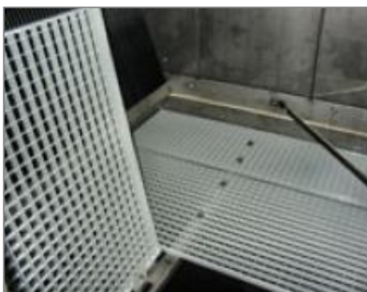
Plate-forme de maintenance interne

Des lignes de lubrification prolongées équipées de graisseurs facilement accessibles peuvent être mises en oeuvre pour lubrifier les paliers d'arbre de ventilateur.