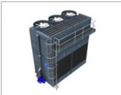
Plate-forme de maintenance externe

La plate-forme externe vous permet d' accéder au sommet des installations extérieures et d'inspecter votre équipement de refroidissement en toute sécurité.